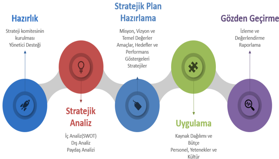
Tablo 2 Stratejik Planlama Döngüsü

Durum analizinin ardından geleceğe yönelim bölümüne geçilerek okulumuzun amaç, hedef, gösterge ve eylemleri belirlenmiştir.