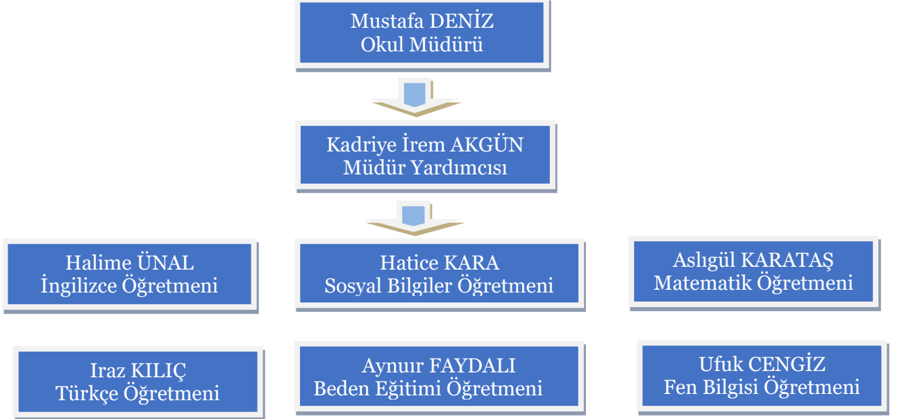
Tablo:9 Teşkilat Şeması